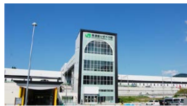
奥津軽いまべつ駅