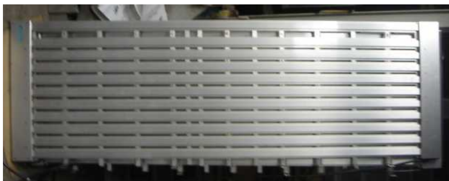
テクヒーター パネルタイプ