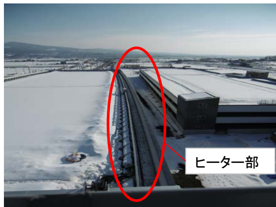
施工後動作時 約2mの積雪